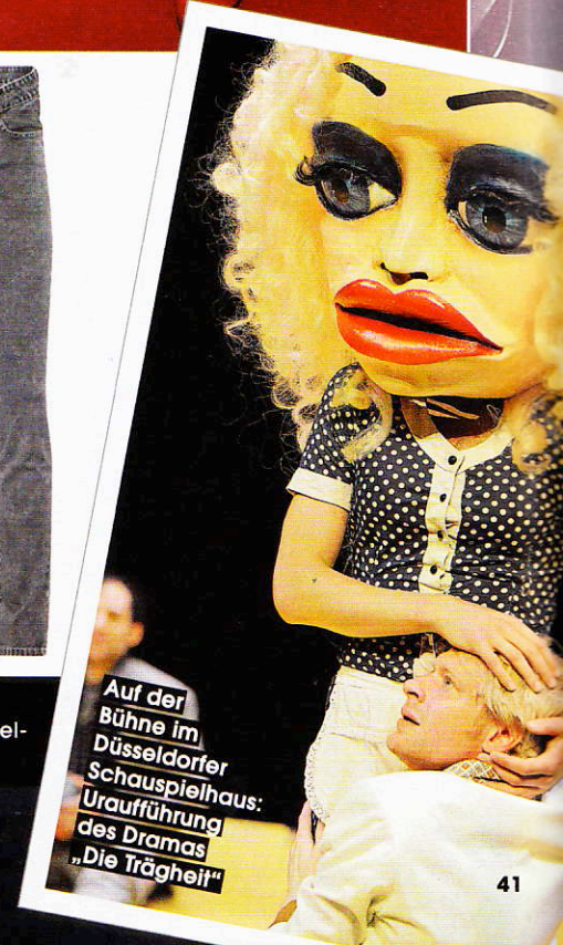
Auf der Bühne im Düssel- dorfer Schauspielhaus: Uraufführung des Dramas „Die Trägheit“

Seit 2009 Ensemblemitglied Düssel- dorfer Schauspielhaus